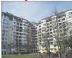
Dans le quartier, les diverses communautés ont encore du mal à s'intégrer entre elles...