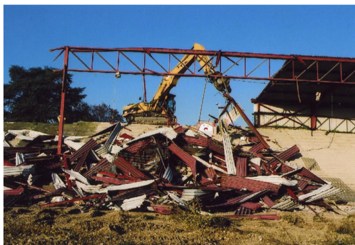
Les grues sont entrées en action. D'ici au mois de janvier, les deux tribunes encore debout seront démolies. Des logements et un grand parc prendront place dans cet espace.