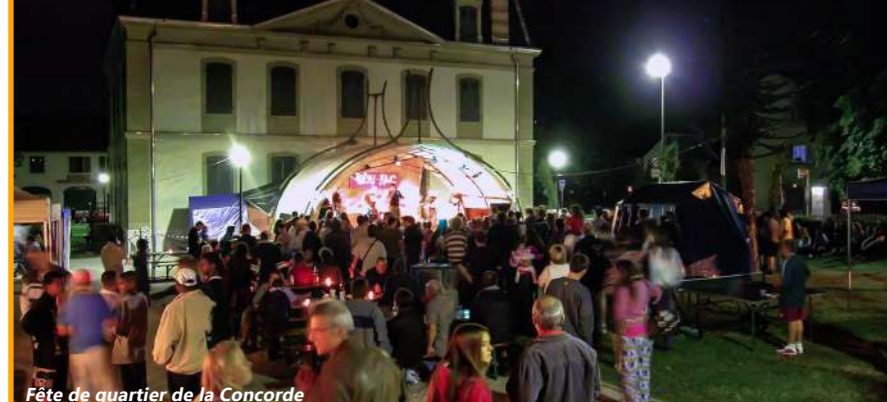
Fête de quartier de la Concorde