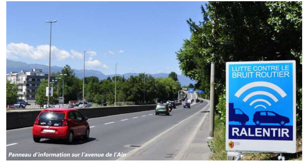
Panneau d'information sur l'avenue de l'Ain

Ces tests, dirigés par le Service des routes et la Direction des Ponts et Chaussées, se développeront, par séquence, sur une année ; ils seront attentivement suivis par les habitants, par l'intermédiaire de la Coopérative Les Falaises et le Forum 1203.