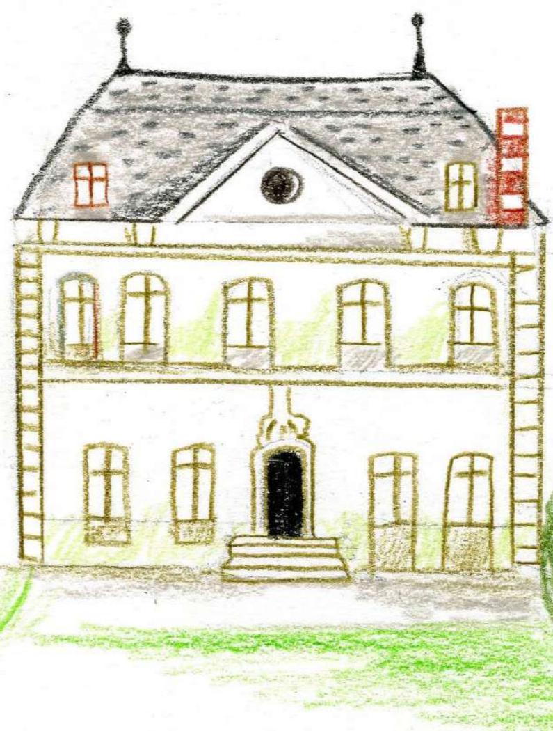
Illustration : Ferme Menut-Pellet - Albertine

« C'EST DANS LA BOÎTE ! » Ateliers, exposition, micros-trottoirs... LUTTE CONTRE LE BRUIT Test à 50km/h sur l'avenue de l'Ain + DE SERVICES Plus de vie dans le quartier LE POINT SUR LES CHANTIERS