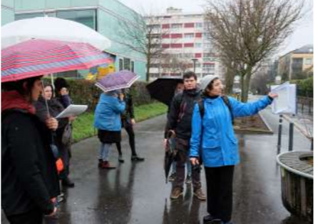
Le 2 ème atelier s'est déroulé

les rues du quartier. Leur mission décrire et repérer, selon eux, les choses positives et négatives des espaces du quartier. Fait original, une dessinatrice était présente pour traduire les idées et les échanges en images. Les dessins ont permis de mettre en évidence les enjeux, les dysfonctionnements et les attentes des usagers (voir l'exposition).