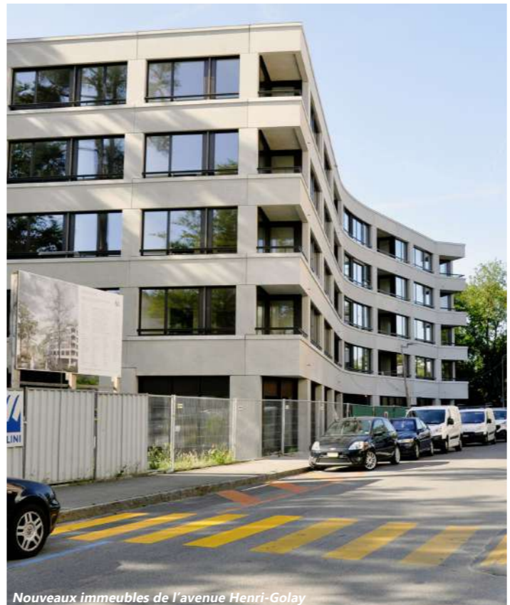
Nouveaux immeubles de l'avenue Henri-Golay

Plus d'info : www.forum1203.ch rubrique : un quartier en devenir