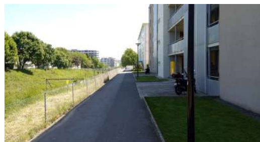
Henri-Golay en direction des Alpes.