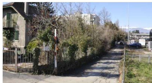
Chemin Croissant en direction du Jura.

Intéressée ? Contactez-nous info@forum1203.ch