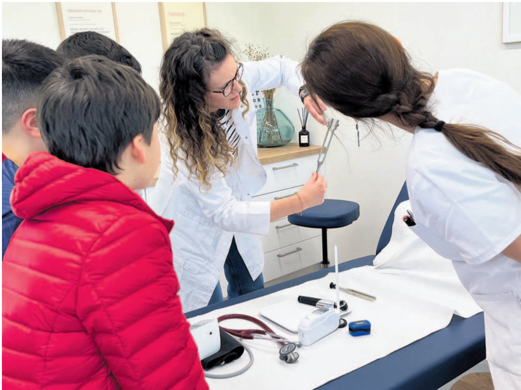
Découverte ludique au cabinet médical Tour de Lyon.