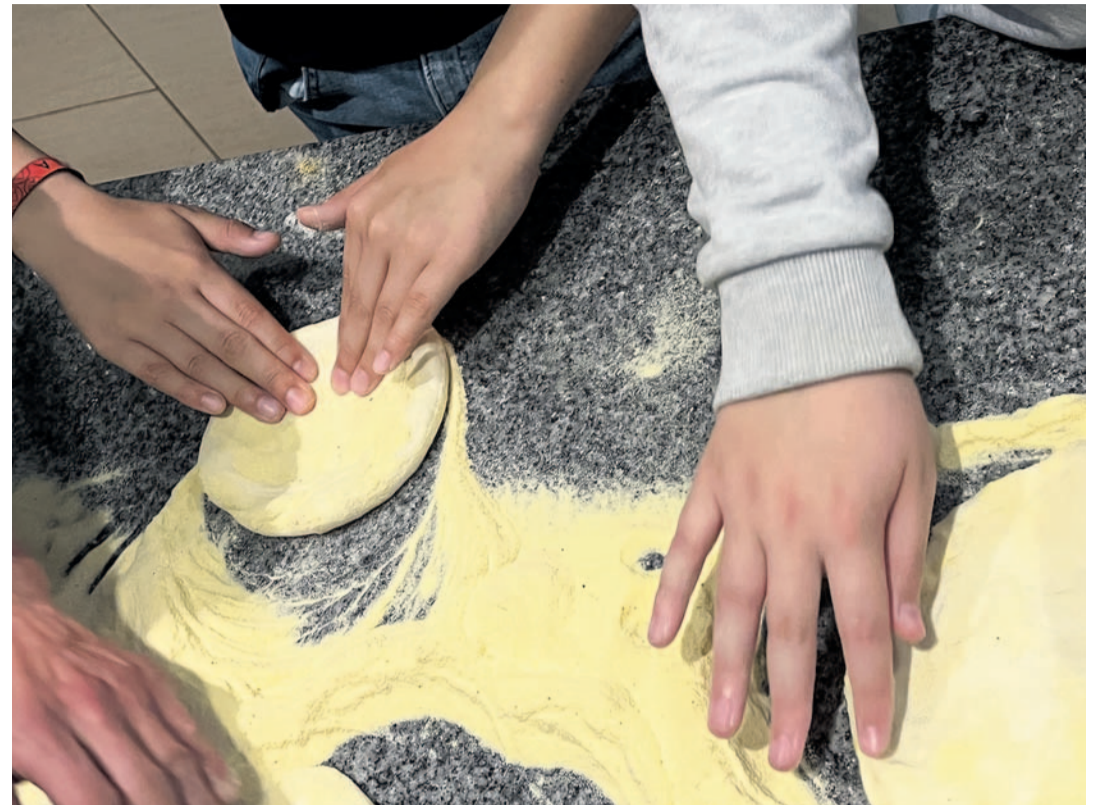
Atelier pizza au Giardino Romano.